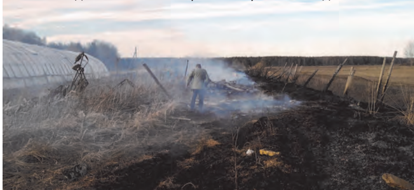
8 апреля 2014 г. огненный фронт подожженной травы вплотную подошел к тепличному хозяйству ЗАО «Победа»

Постановлением главы местной администрации от 04.03.2014 № 74 «О мерах по предупреждению и ликвидации возможных лесных (торфяных) пожаров на территории МО Аннинское сельское поселение в пожароопасный период 2014 года» на всей территории муниципального образования введен особый противопожарный режим. Сохраняется высокая пожароопасность. Практически ежедневно, а порой и по несколько раз в день, поступают сообщения о возгораниях. Несмотря на предупреждения, происходят поджоги сухой травы.